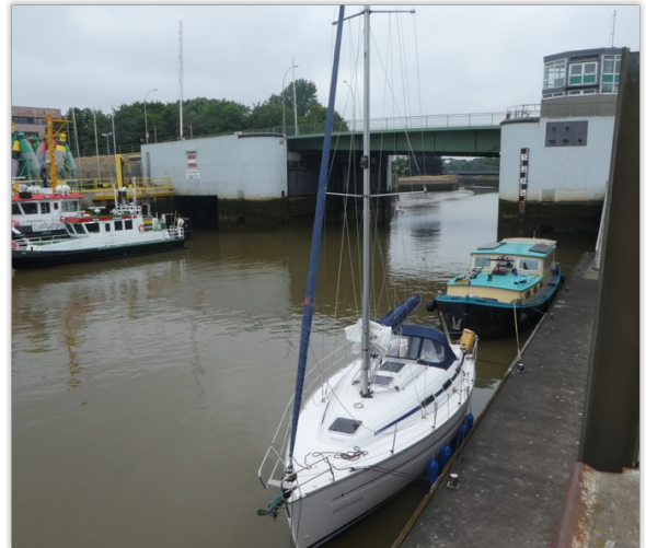
Bij de Kennedy brug