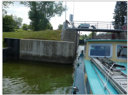
Sluis Lintig zelfbediening