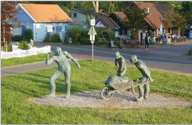
Standbeeld langs de dijk