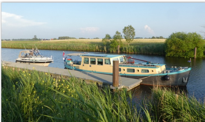
Ligplaats voor de sluis met roosters niet fijn voor Lola