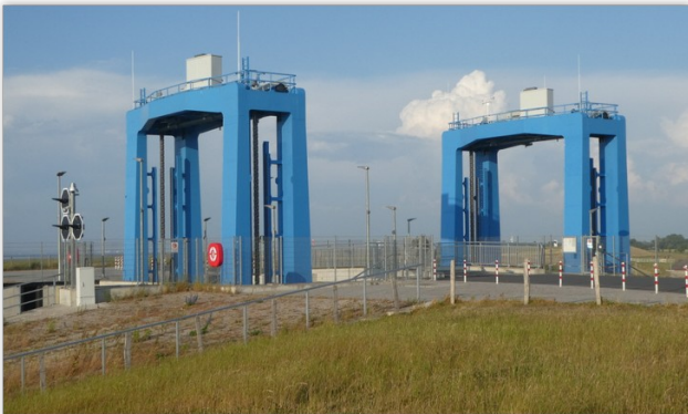
Nieuwe sluis Otterndorf