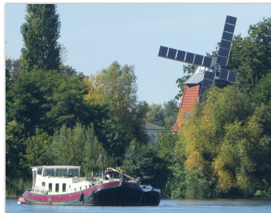
Wieken met zonnepanelen