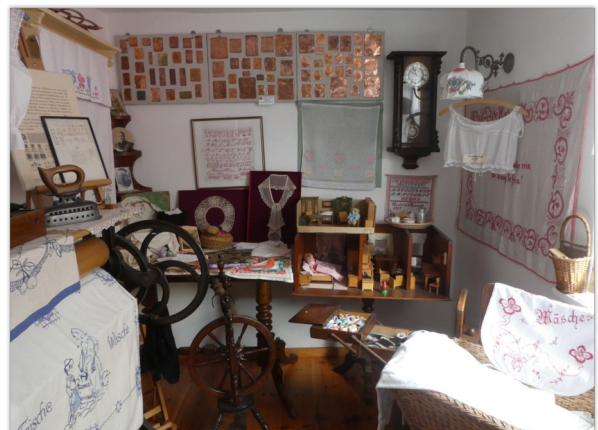
In het Heimathaus