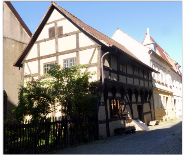
Beeskow burcht en oudste huisje