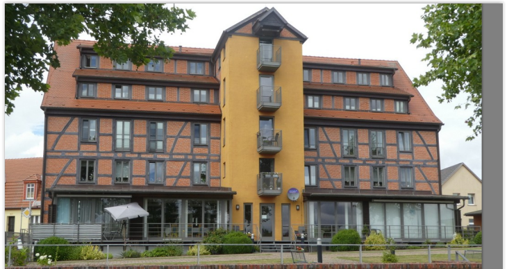
Pakhuis wordt bejaardenhuis